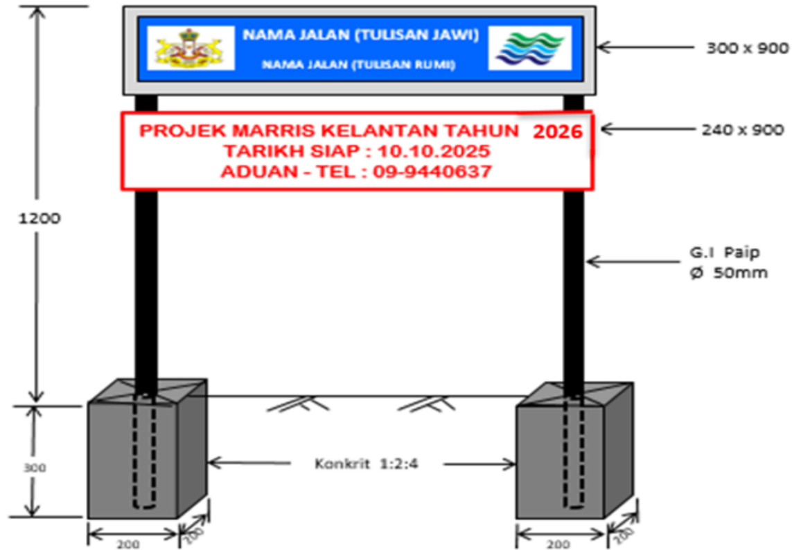
PANDANGAN HADAPAN & BELAKANG